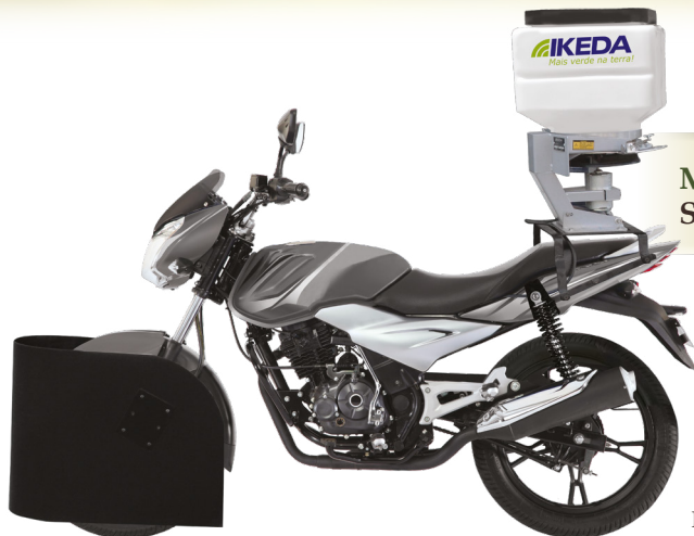
MOTO SEMEADORA MS-40 Semeadora / Adubadora