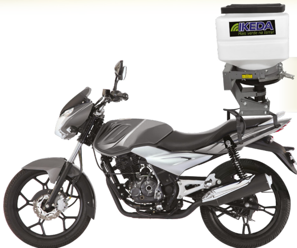
MOTO SEMEADORA MS-40 Semeadora / Adubadora