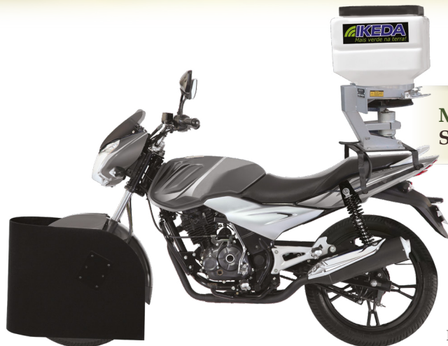
MOTO SEMEADORA MS-40 Semeadora / Adubadora