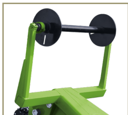
Suporte para carretel de fibra óptica.