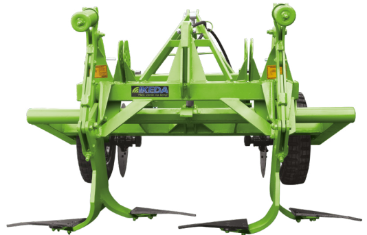
EBT 220 MA ( vista trasera )