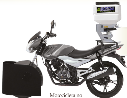
Motocicleta no incluída.