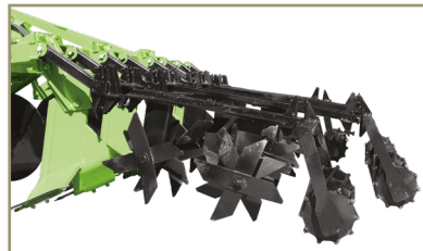
Grada desterronadora y rodillonivelador.