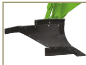
Polietileno (suelos arcillosos y mixtos)